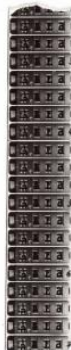
Abonenttalituse tööruumid Estonia pst.1. Paremalt Fotomaxi filmilint.