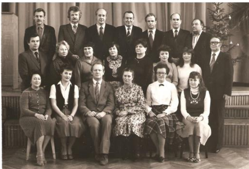
Energiamüügi osakondade ja talituste juhatajad. Foto 1980-date keskelt.